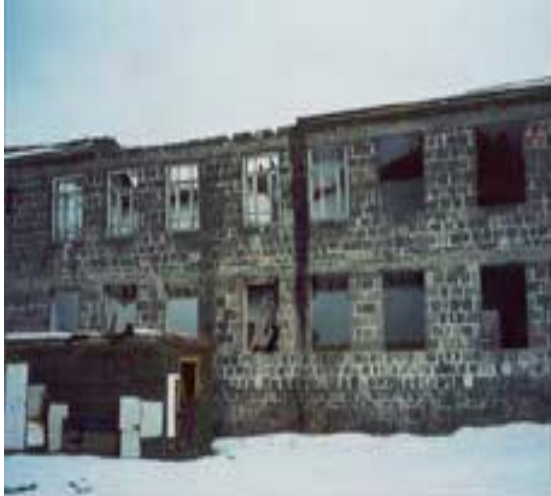
ԴՊՐՈՑԻ ՀԻՆ ՏԵՍՔԸ