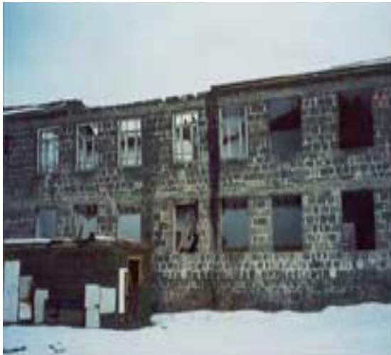
ԴՊՐՈՑԻ ՀԻՆ ՏԵՍՔԸ